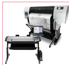
Stand en version basse pour scanner au côté de l'imprimante