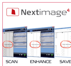
Le logiciel next image assure une excellente qualité de numérisation et vous permet même d'améliorer la qualité des originaux