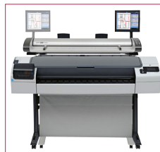
Pour une meilleure ergonomie utilisez l'écran tactile sur le côté gauche ou droit