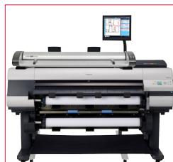
IQ Quattro 44 MFP Repro