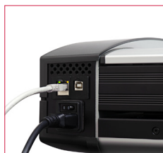
Copie vers un nombre illimité d'imprimantes, via le réseau ou par connexion USB