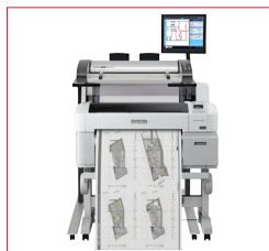
IQ Quattro 24 MFP Repro