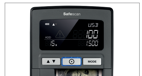
Affiche la quantité et la valeur des billets scannés