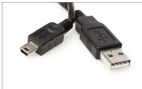
Safescan Câble USB Art. no: 112-0459