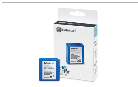
Safescan LB-105 Batterie rechargeable Art. no: 112-0410