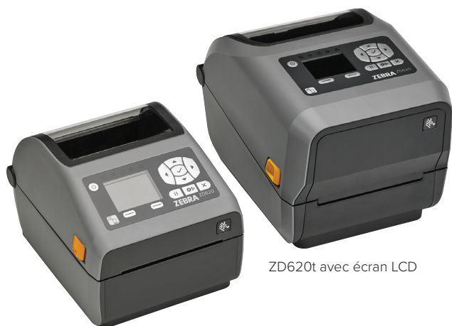
ZD620d avec écran LCD

Lorsque la priorité est à la qualité d'impression, à la productivité, à la flexibilité des applications et à la simplicité de la gestion, la ZD620 est idéale. Nouvelle génération de la gamme des imprimantes de bureau Zebra, la ZD620 remplace les célèbres imprimantes GX Series et ZD500. Avec une qualité d'impression exceptionnelle et des fonctionnalités hors pair, elle n'a aucun mal à se démarquer des imprimantes de bureau conventionnelles. Déclinée en modèles thermique direct et transfert thermique et en modèles spécialement conçus pour l'industrie de la santé, l'imprimante ZD620 s'intègre dans les environnements les plus divers. Elle offre la plupart des fonctions standard de toute imprimante de bureau Zebra, ainsi qu'une interface utilisateur facultative à 10 boutons sur écran couleur LCD, qui vous informe en permanence sur la configuration et l'état du périphérique. La ZD620 exploite Link-OS® et est prise en charge par Print DNA, puissante suite d'applications, d'utilitaires et d'outils de développement qui améliore l'expérience d'impression, grâce à une meilleure performance, une gestion à distance simplifiée et une intégration plus aisée. La Zebra ZD620 offre la vitesse d'impression, la qualité d'impression et la gérabilité indispensables à la progression de votre activité.